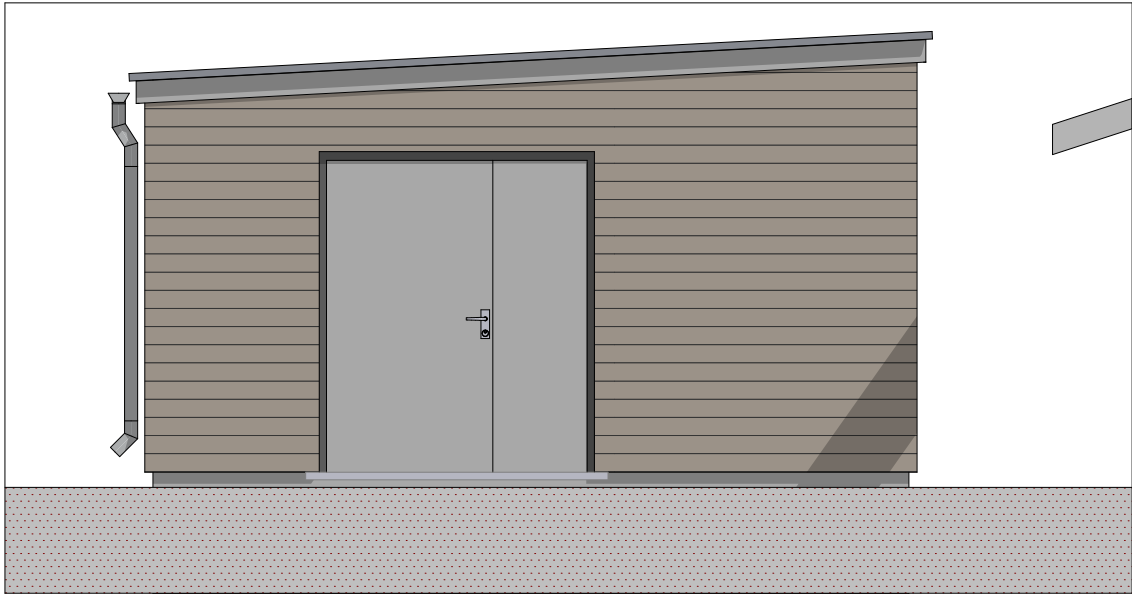
Fasade Vest - bod BF12